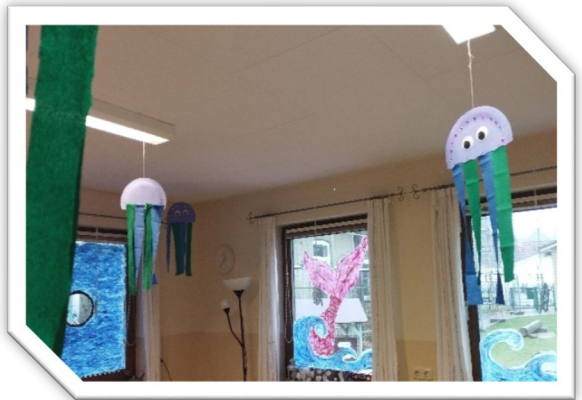
Faschings-Deko im Restaurant

Es rumpelt auch musikalisch - unser Faschingsfest naht! In unserem gemeinsamen Plenum und den Gruppenkreisen werden verschiedene Faschingslieder geschmettert.