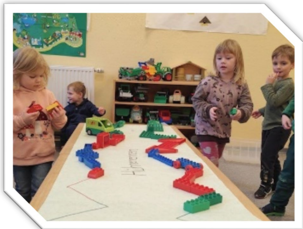
Hühnerrennen - ein selbst gestaltetes Spiel

Seit Anfang des Jahres beschäftigen sich die Gruppen mit dem Bilderbuch und der dazu gehörigen Musik – „Karneval der Tiere“ von Camille Saint-Saens.