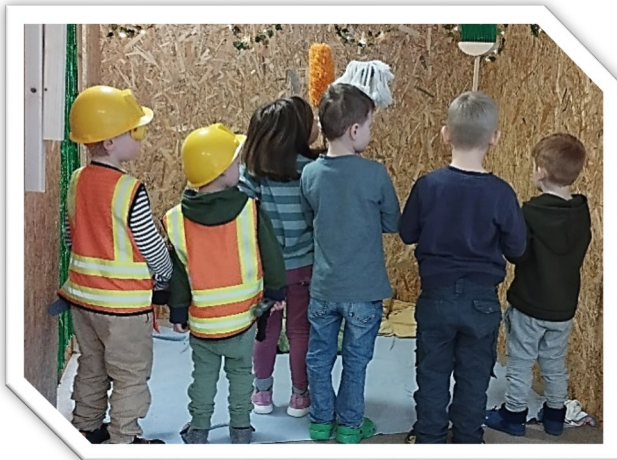
Verschiedene Kostüme auf der Bühne

Wie in jedem Jahr haben die Kinder das Thema ausgewählt.